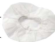
8107419 / 8513404