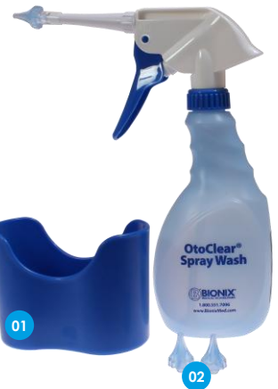
Komplettes Set: 8519371